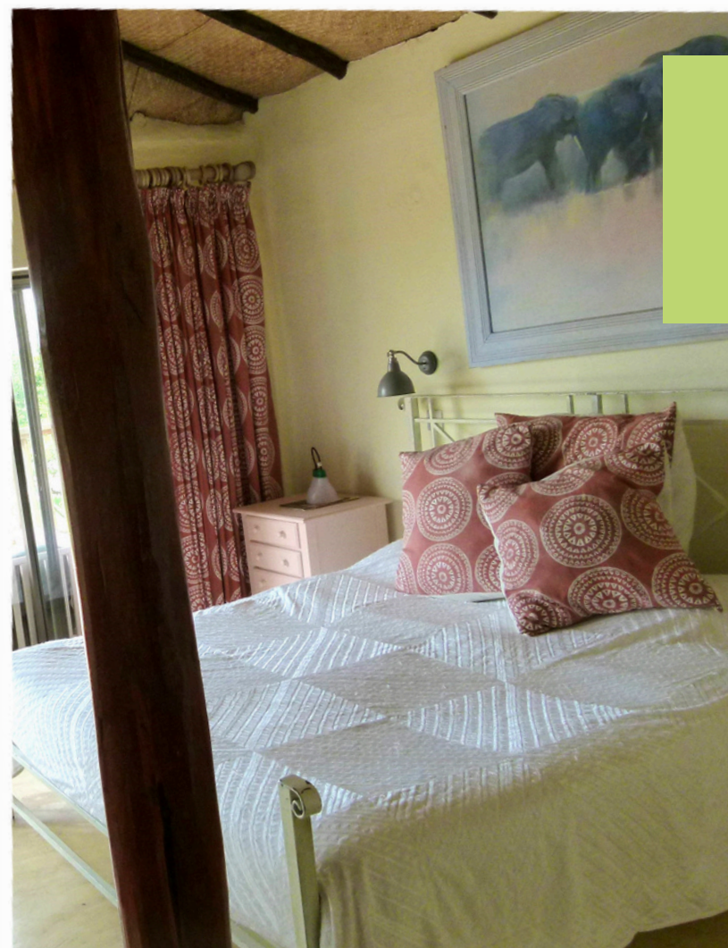
OL PEJETA Pelican House