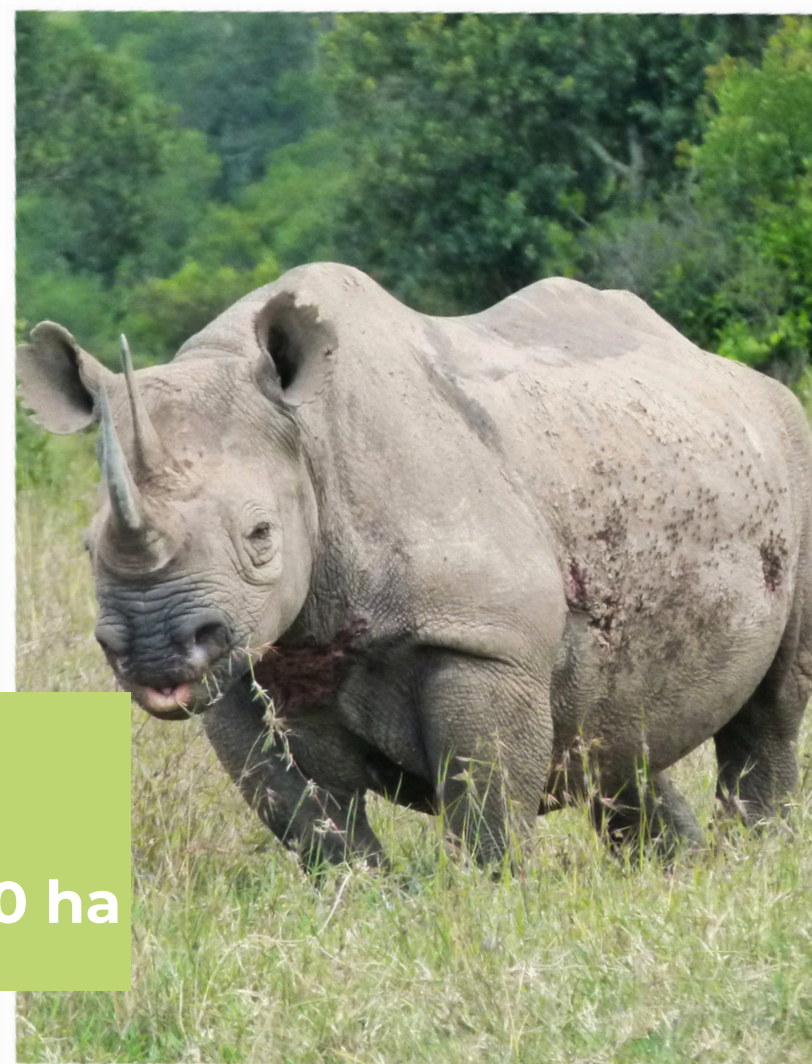
FAUNE SAUVAGE Réserve privée de 36 000 ha